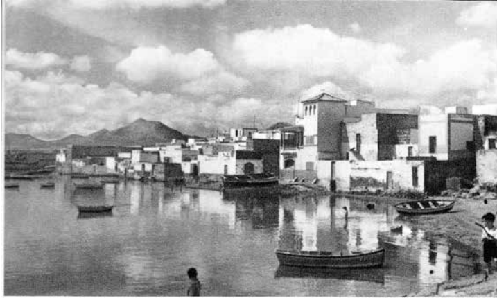
Charco de San Gines. Lanzarote.