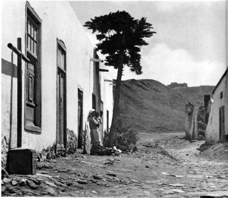
Castillo de Teguse.