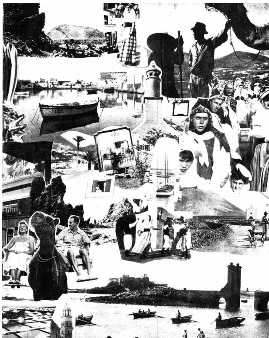
Figura 6. Fotomontaje que acompaña el artículo de Eduardo Boehme de Lemos intitulado “Lanzarote, la isla de los volcanes”, Isla , Las Palmas de Gran Canaria, ext. Navidad 1953. Entre las fotografías hay algunas de Daniel Martín. Archivo Municipal de Teguiise.