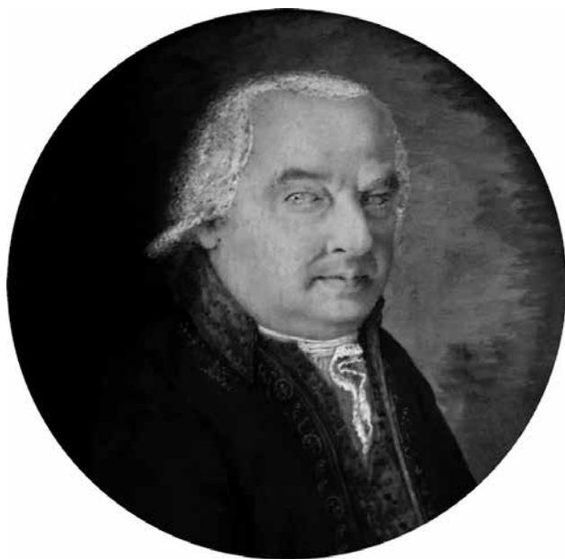
Miniatura de José Clavijo y Fajardo.