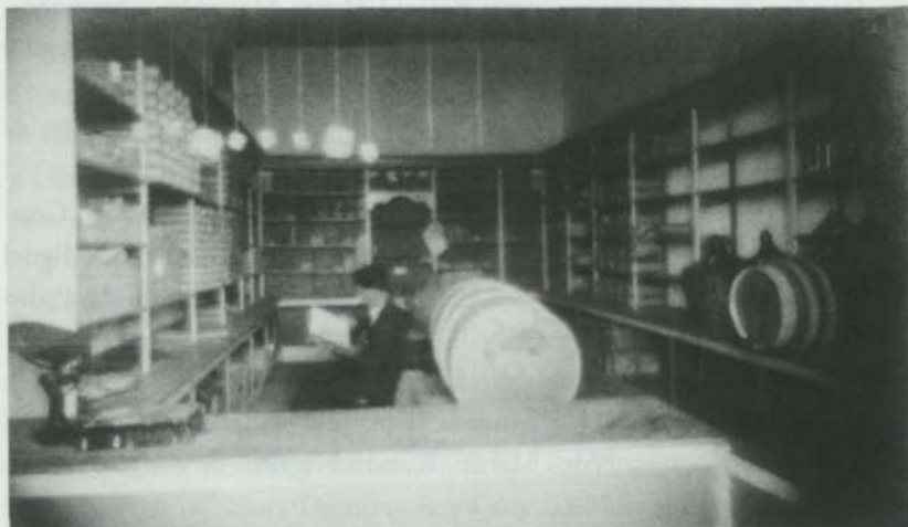
Interior de una tienda de Arrecife. 1923

El inicio de las hostilidades en el escenario europeo, perceptibles desde 1914, producirá en Canarias la primera gran crisis del siglo actual. No hay que olvidar que el modelo económico “puertofranquista” colocaba a la economía isleña en contacto directo con la economía internacional; por lo tanto, su crecimiento económico era enormemente sensible a los flujos y reflujos de esta última.