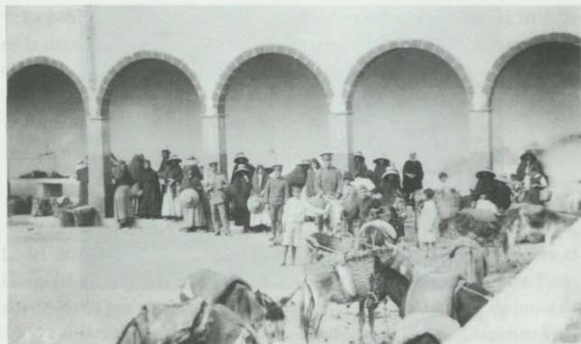
Recova de Arrecife con sus personajes tradicionales

familiar, el número de miembros, la edad, hasta, excepcionalmente, el tipo de “dureza” de la profesión.