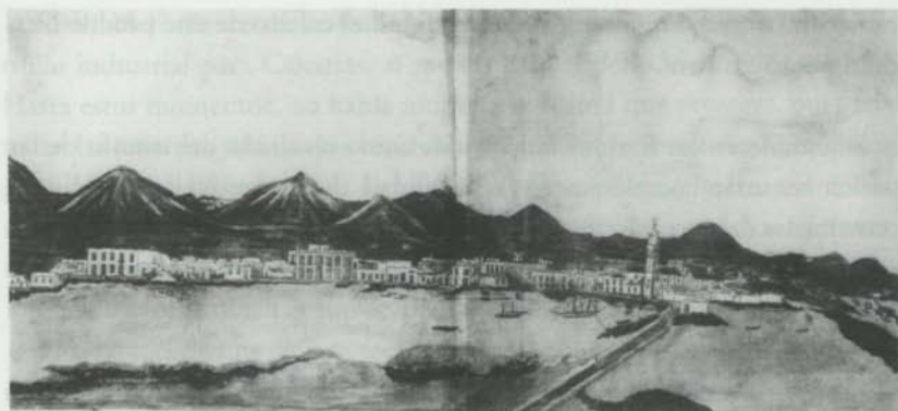
Vista del Puerto del Arrecife en la Isla de Lanzarote tomada desde la Plaza del Castillo. El Puerto del Arrecife en 1845, por D. Félix González de Torres.

El Puerto del Arrecife (1845). Copia de J.A. Álvarez del original de Félix González de Torres