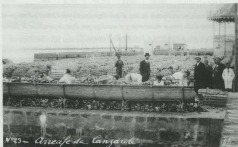
Cebollas preparadas para exportar en el Muelle Chico

Los garbanzos y las cebollas cultivados a partir de 1876, conocen un proceso de exportación al mercado cubano hasta 1898, permitiendo que Lanzarote soportara con cierto desahogo el “crack” de la cochinilla y la escasez de cereales 226 . El cultivo del tabaco isleño, implantado en la zona de Tinajo aporta, junto a las legumbres, algún beneficio a la economía de Lanzarote, dando lugar a la instalación de la fábrica de cigarrillos “La Defensa”, situada en la calle Real nº 25.