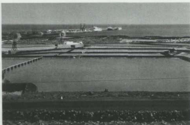
Antigua salina de Arrecife. 1972