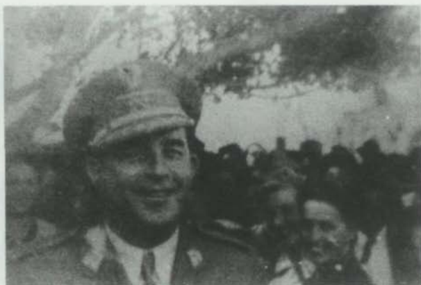
El capitán general García Escámez en visita a Lanzarote

El Mando Económico, aunque respondiera a imperativos de la postguerra civil en plena conflagración mundial, también debe relacionarse con las tendencias proteccionistas observadas en la Península desde el siglo XIX. Canarias con una estructura económica diferente se encontró encorsetada por este sistema económico.