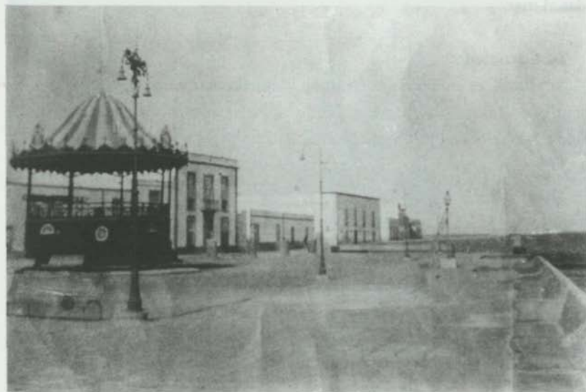
Quiosco de la música

lución ha sido la de la propia ciudad, del comportamiento y sentir de sus habitantes.