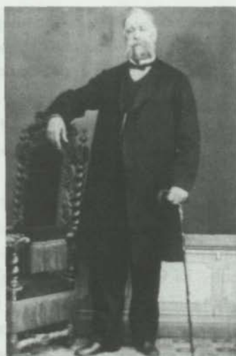
Agustín González Yáñez, fundador de "El Crisol" (1858), pionero de las publicaciones lanzaroteñas