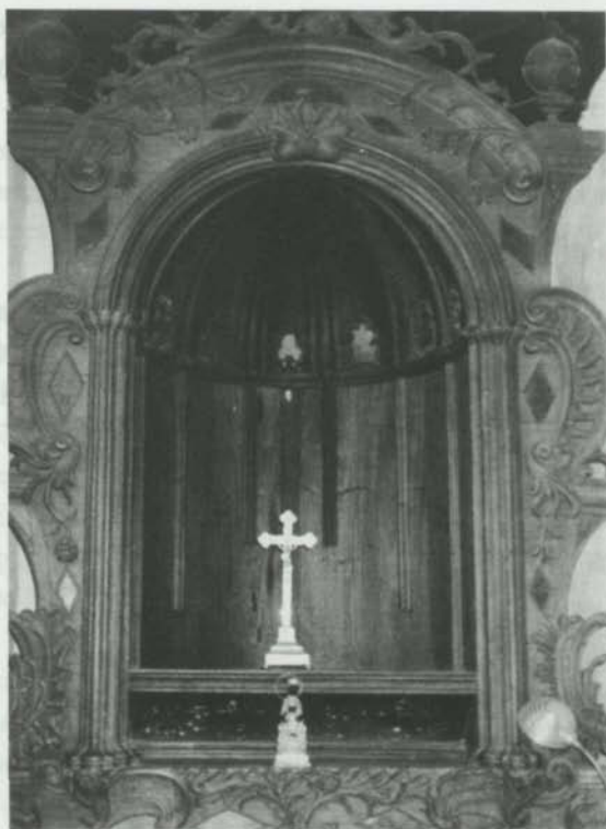
Oratorio de la Casa Arroyo

La vivienda fue mandada a construir en la primera mitad del siglo XVIII por el coronel y gobernador de las armas de la isla, Manuel de Armas Scorcio-Caldas y Bethencourth.