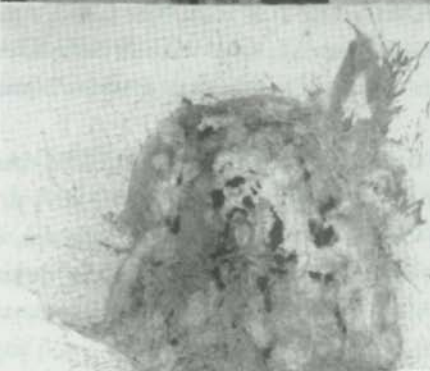
César Manrique en su estudio