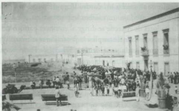
Procesión de la Virgen del Carmen por la Marina. Arrecife. 1923

La imagen del Carmen 521 fue bendecida el 24 de junio de 1729 en este convento. Más tarde será trasladada a la iglesia parroquial, concretamente en 1875.