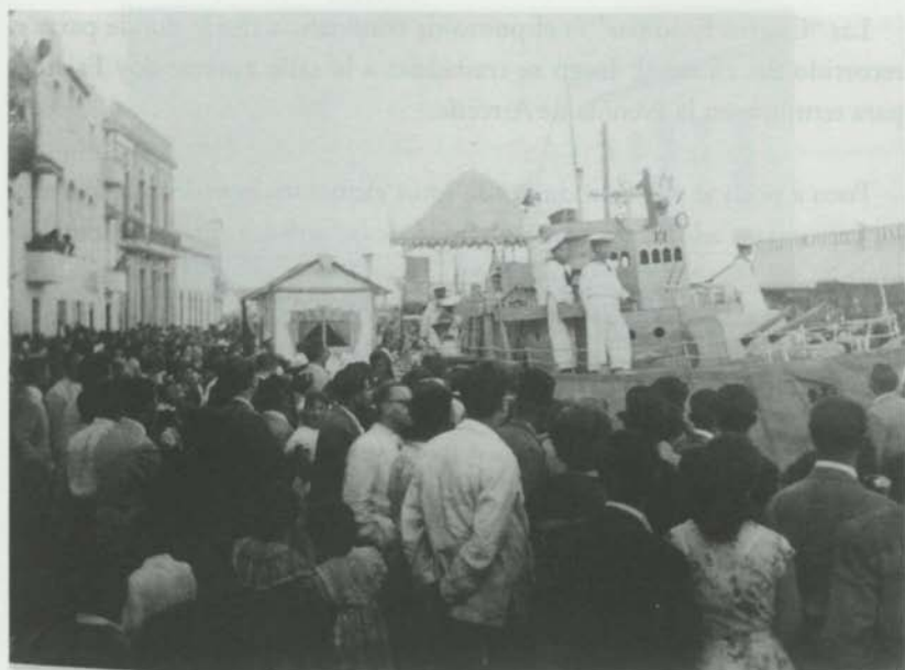
Una vieja imagen del carnaval de Arrecife

Hay que enmarcar la fiesta en el contexto de una sociedad sometida a constantes miserias y hambrunas que atizan a la población. A pesar de la dureza de la vida cotidiana, la gente se vuelca en la fiesta.