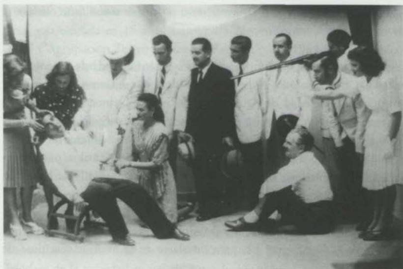
Representación teatral en "La Democracia"

En las actividades deportivas han sido pioneros en el fútbol, el baloncesto, el ajedrez, la gimnasia, etc... El primer equipo de fútbol, el mal llamado de los negros (azules), estaba integrado por socios de esta entidad, al igual que el Club de Fútbol Fénix Sociedad Democracia de 1930.